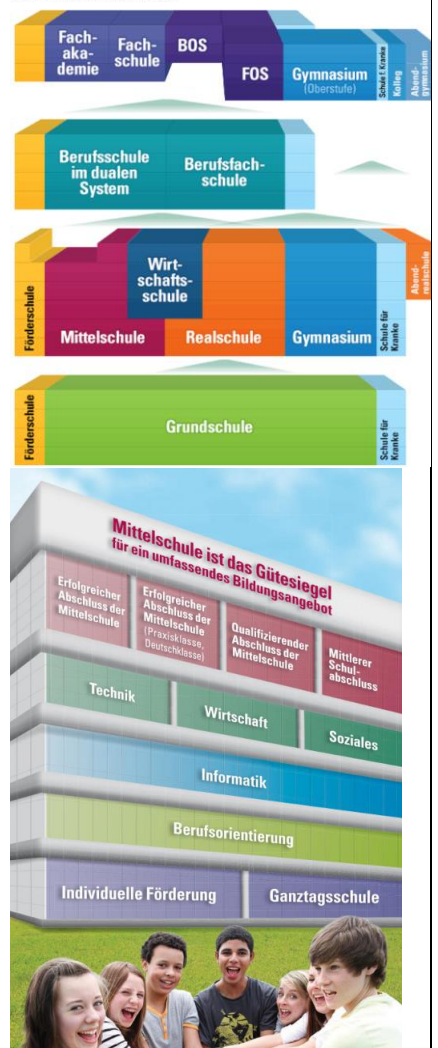
Das bayerische Schulsystem

Nur ein Weg ist der richtige: der EIGENE .